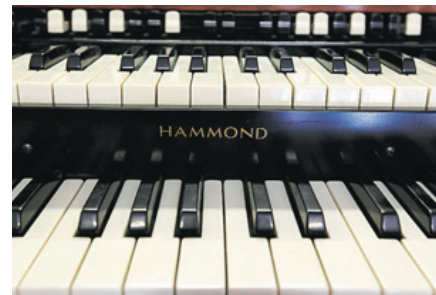
Laurens Hammond, som uppfann orgeln, gjorde från början klockor. En Hammondorgel har två klaviaturer, manualer, och oftast en Leslie-högtalare intill.