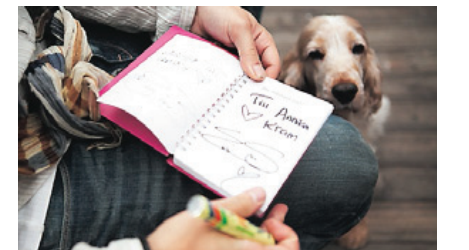
I går gjorde Eric Saade hembesök i Kimstad – spelade och skrev autografer.