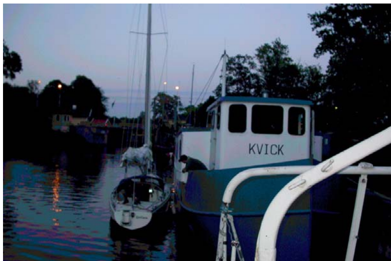
Trygg och säker Norsholmshamn.