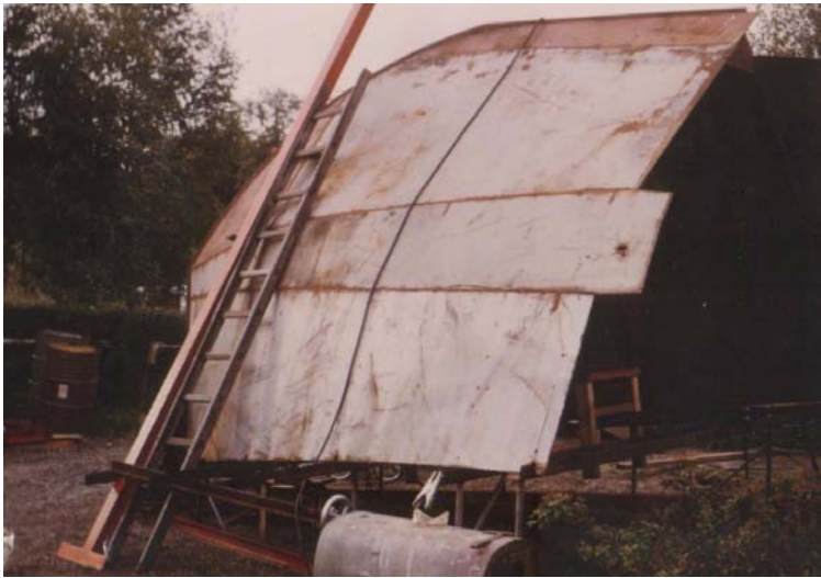
Fören börjar ta form.