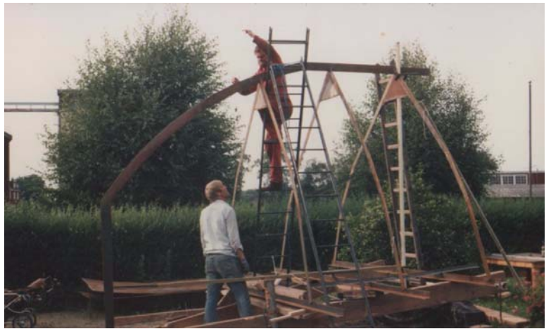
Nu ska Kvik få en riktig för. Den byggs i trädgården 1986.