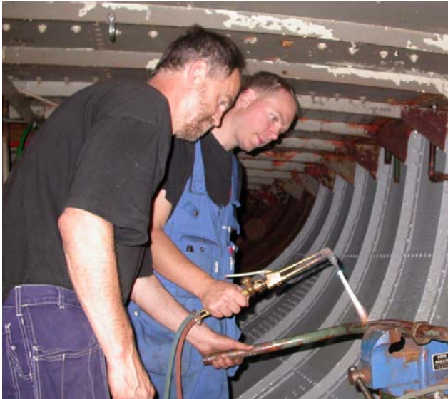
Kylvattentrör till Bolindern bockas och löds.