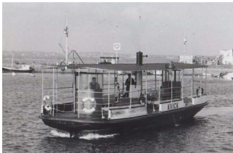
Helsingborgs hamnfärja Kvick byggd 1938.