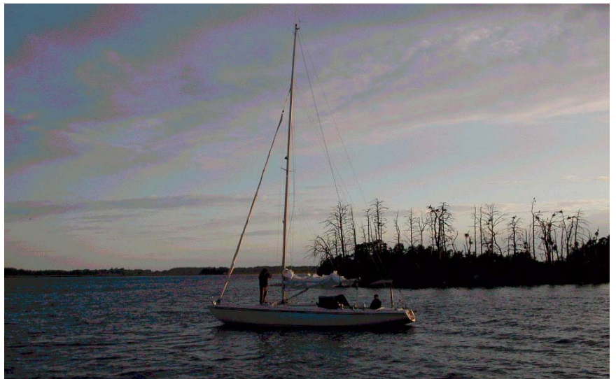
Segelbåt på grund vid skarvön sen kväll den 22 juni 2006.