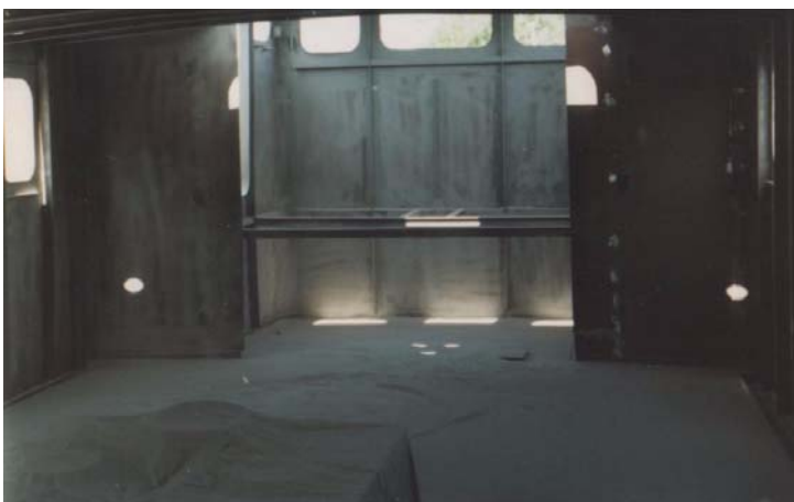
Kvick blåstras invändigt och utvändigt.