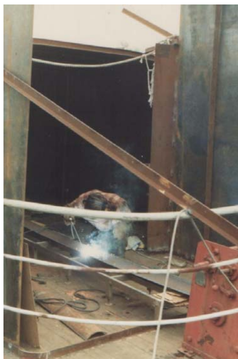
Carl Axel klyver ett rör och använder det för att göra rundade hörn åt bland annat styrhytten.