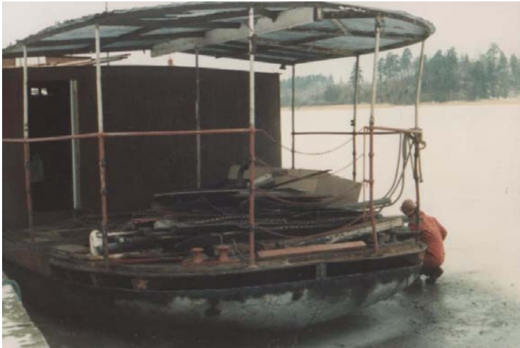
Kvick fastfrusen vid Norsholms fyr. Från isen kan Carl Axel jobba lättare. Akterplåtarna pressas upp på plats med hjälp av en domkraft som tar spjörn mot isen.