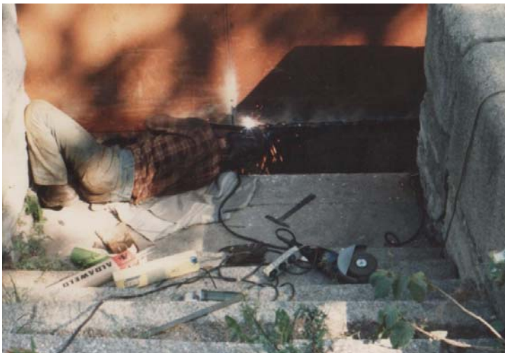
Sommartid får man ta till andra hjälpmedel än isen.