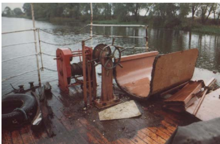
En av dom två styrhytterna togs bort.