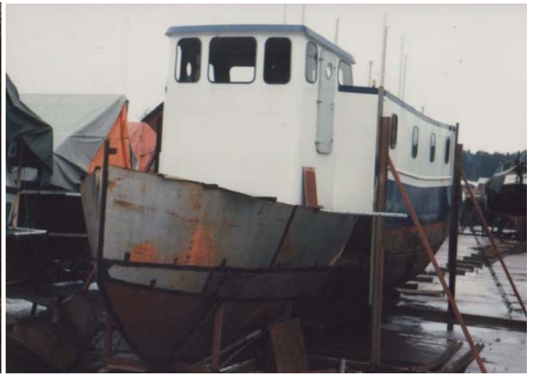
Den gamla aktern utbytt mot en ny för.