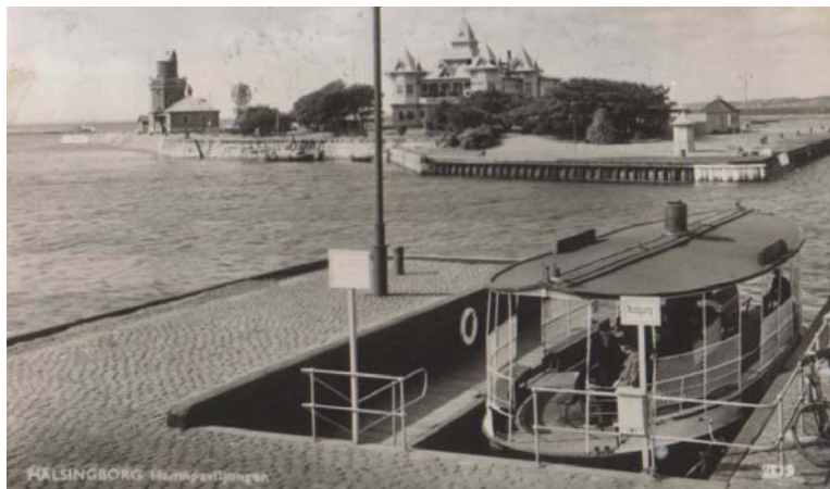
Kvick gick mellan Helsingborgs hamn och paviljong.