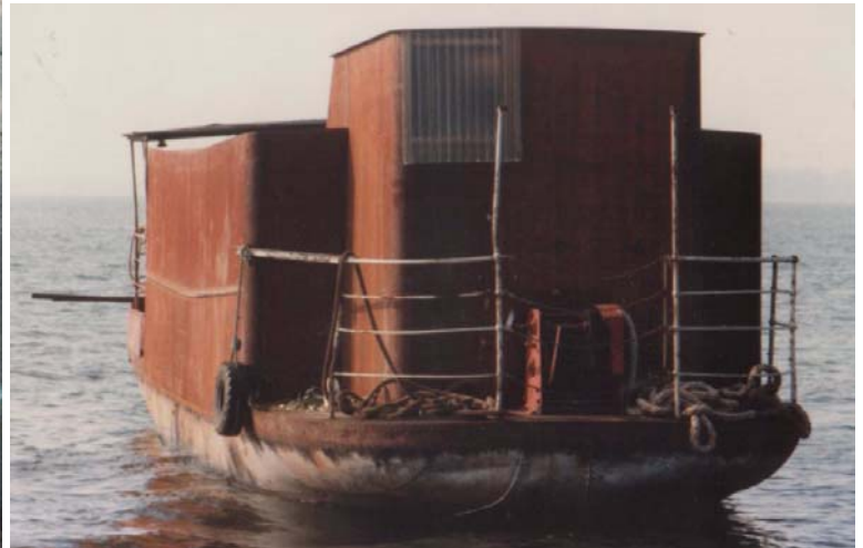
Kvick på Roxen. Dock utan en riktig för. Men det kommer!