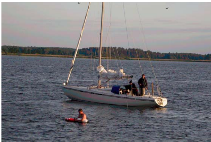
Inte undra på att seglarna inte kom någon vart.