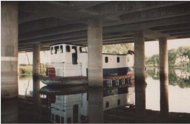
Ska man måla en båt ska det göras under en bro. ☺