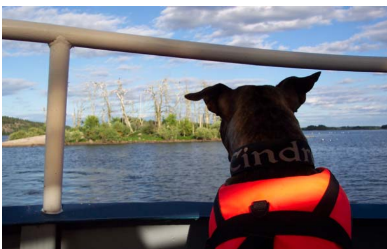
Amstaff Tindra spanar in skarvön.