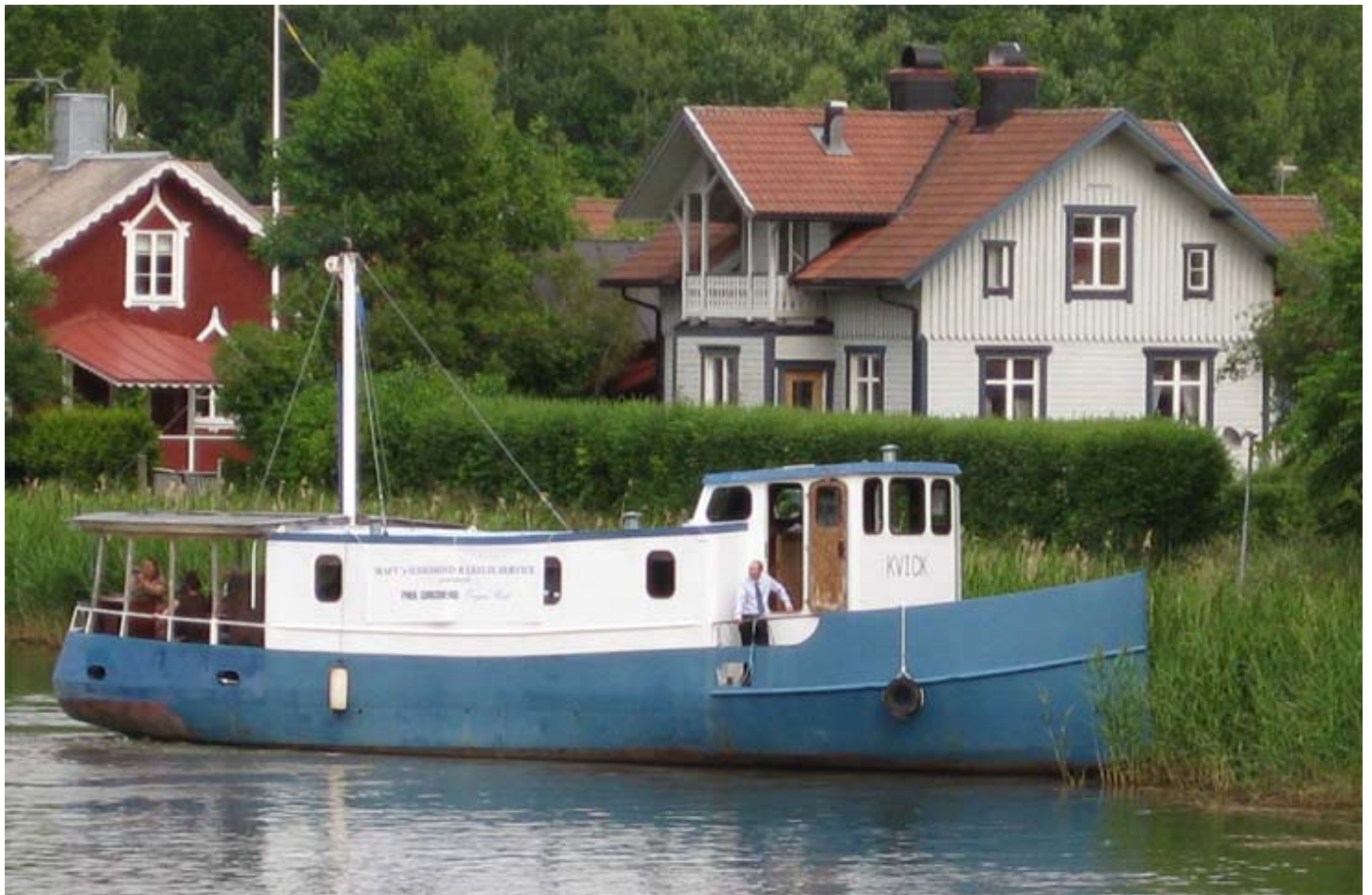
Båten Kwick framför Magnus & Malins hem 2008.

Film från spelningen ses här: http://www.youtube.com/watch?v=yW2UGDWLICc&feature=channel